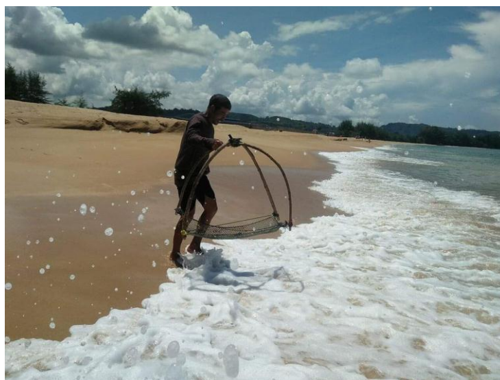
ภาพที่ 2 การจับจักจั่น

สถานที่ต่อมา คือ นาผืนสุดท้าย มีพื้นที่ประมาณ 120 ไร่ เป็นโครงการเชิงอนุรักษ์อาชีพชาวนา ภูเก็ตอย่างจริงจัง ในปี พ.ศ. 2554 ถือเป็นจุดเริ่มต้นโครงการที่เน้น “นาผืนสุดท้ายของจังหวัดภูเก็ต” ภาพชาวนาตีข้าวและสีข้าวคงเป็นภาพที่ไม่คุ้นตาชาวภูเก็ตมากนัก “ปลูกวันแม่เก็บเกี่ยวกับพ่อ” แต่กิจกรรมการดำน้ำ เกี่ยวข้าวที่ได้สัมผัสวิถีชีวิตการทำนาของชาวบ้านที่นี้ยังคงส่งเสริมองค์ความรู้และ ภูมิปัญญาท้องถิ่นให้เกิดขึ้นในจังหวัดภูเก็ต