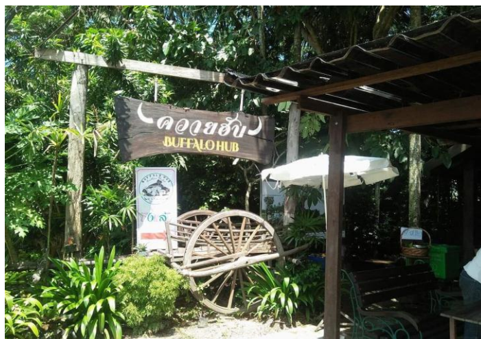
ภาพที่ 4 ควายฮับ

สถานที่สุดท้าย คือ ควายฮับ เป็นสถานที่ที่มีกิจกรรมการเลี้ยงกระบือ ที่เน้นการดำรงวิถีชีวิตเกษตรและประกอบอาชีพด้วยพื้นฐานภูมิปัญญาท้องถิ่น ปัจจุบันการรวมกลุ่มผู้เลี้ยงกระบือทำให้เกิดการช่วยเหลือซึ่งกันและกันเพื่อให้สามารถมีรายได้พอเพียงในบริบทของการดำรงชีพปัจจุบัน ซึ่งกิจกรรมที่สามารถส่งเสริมให้นักท่องเที่ยวเข้ามามีส่วนร่วม ได้แก่ การเลี้ยงกระบือ การให้อาหารกระบือ และการอาบน้ำกระบือ ที่สามารถสร้างประสบการณ์ที่แปลกใหม่ให้นักท่องเที่ยว และทำให้นักท่องเที่ยวได้สัมผัสวิถีดั้งเดิมได้เป็นอย่างดี