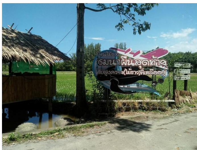
ภาพที่ 3 นาผืนสุดท้าย

สถานที่ต่อมา คือ นาผืนสุดท้าย มีพื้นที่ประมาณ 120 ไร่ เป็นโครงการเชิงอนุรักษ์อาชีพชาวนา ภูเก็ตอย่างจริงจัง ในปี พ.ศ. 2554 ถือเป็นจุดเริ่มต้นโครงการที่เน้น “นาผืนสุดท้ายของจังหวัดภูเก็ต” ภาพชาวนาตีข้าวและสีข้าวคงเป็นภาพที่ไม่คุ้นตาชาวภูเก็ตมากนัก “ปลูกวันแม่เก็บเกี่ยวกับพ่อ” แต่กิจกรรมการดำน้ำ เกี่ยวข้าวที่ได้สัมผัสวิถีชีวิตการทำนาของชาวบ้านที่นี้ยังคงส่งเสริมองค์ความรู้และ ภูมิปัญญาท้องถิ่นให้เกิดขึ้นในจังหวัดภูเก็ต